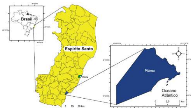
Figura 1 – Área de estudo: município de Piúma, litoral sul do Espírito Santo, Brasil.

Consoante ao exposto, este estudo apresenta uma análise integrada das unidades geológicas relacionadas às atividades pesqueiras artesanais no município de Piúma (Figura 1), litoral sul do Espírito Santo ( Supporting Information 1 ), com o intuito de apresentar informações específicas de cada ecossistema explorado para futuras ações de gestão compartilhada e/ou conservação dos recursos pesqueiros das regiões costeiras do sul do Estado.