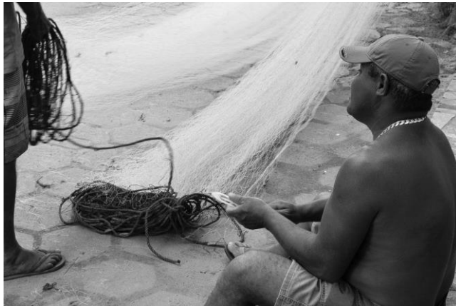
Imagem 12 – A solidariedade.

Encontramos remendadores de rede de pesca ainda utilizando a rua (ver imagem 12).