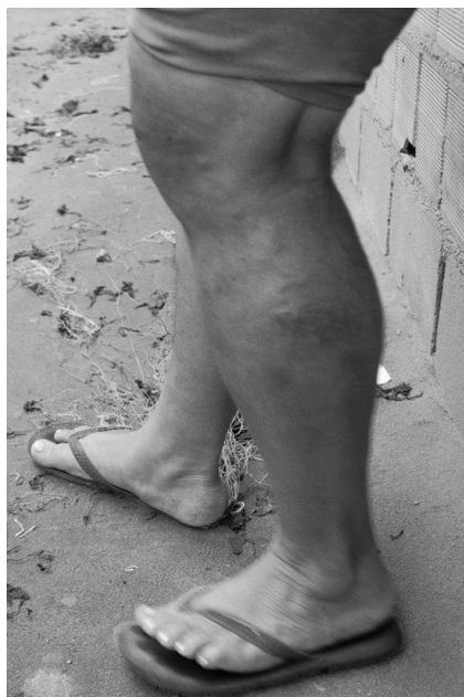
Imagem 11 – Marcas da atividade.

A atividade é realizada de pé, sem a possibilidade de o artesão sentar ou se encostar para “descansar as pernas”. “O trabalho é muito cansativo por ser feito em pé. Tenho um compadre que morreu de trombose. Eu mesmo vivo com dores nas varizes”, relatou um dos artesãos entrevistados.