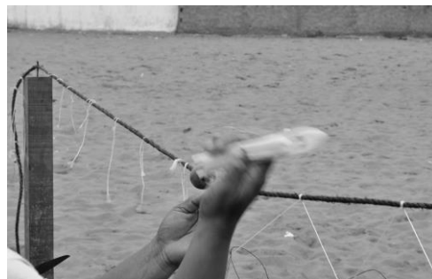
Imagens 13 e 14 – Entralhando a rede.

Enquanto estão trabalhando nas redes, estão com os ouvidos atentos aos filhos que brincam ali próximo. Em muitos casos, a porta da cozinha está a alguns metros, pois não podem deixar de realizar as atividades “típicas das mulheres” do vilarejo. Enquanto remendam rede, ficam atentas ao sinal da panela de pressão e a crianças que perto correm.