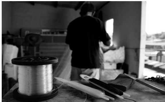
Imagem 3 e 4 – Mão e ferramentas do ofício em ação.

As ferramentas utilizadas no ofício de fabricação e remendo de rede são: uma faca pequena e amolada (quase sempre pendurada no pescoço por uma corda em forma de cordão); uma pedra de limar; agulhas de remendar rede de pesca com “ nylon duro” e “ nylon mole”. Nota-se nas imagens 3 e 4 as facas bastante desgastadas, resultado de um trabalho constante e da exigência de esta ferramenta está sendo sempre amolada.