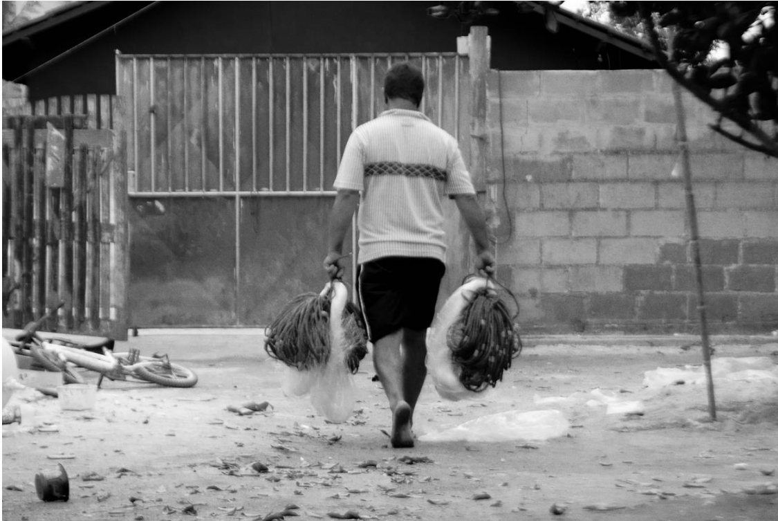
Imagem 17 – Findando o dia de trabalho.