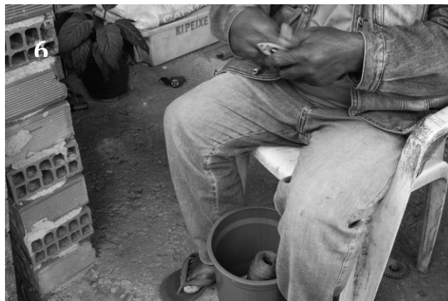
Imagens 5 e 6 – Colhendo a rede e enchendo agulha de pesca. Fotografias: Rochele Tenório Silva.

Realizado os preparativos anteriormente mencionados, o artesão dá início ao remendo da rede. A partir desse momento, poucas coisas serão capazes de retirar sua concentração e seus olhos de sobre a rede. A tarefa inicial é, a partir da ponta direita da rede, encontrar “rasgados” e “malhas corridas”. A busca se dá esticando o pano com os dois braços (ver imagem 7). Por malhas corridas entendem as malhas que ao serem forçadas pelo peixe ou por alguma pedra acabam abrindo sem que o nylon se rompa, apenas tendo os nós “escorregado”. Nesses casos a tarefa é retornar o nó para seu devido lugar, o que ocorre por meio de uma força no sentido contrário auxiliado por um pouco de saliva do artesão (ver imagem 8). A língua também é usada para identificar se a rede está devidamente “endoçada”. Para essa tarefa, costuma-se utilizar uma luva ou um pedaço de câmara de ar de pneu enrolada na mão direita.