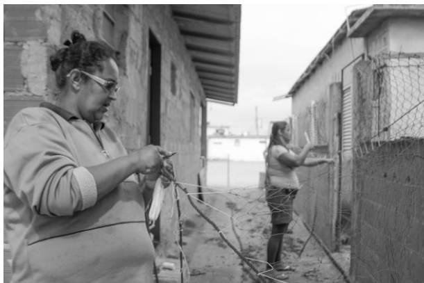
Imagens 15 e 16: Fora de casa, mas nem tão fora assim.