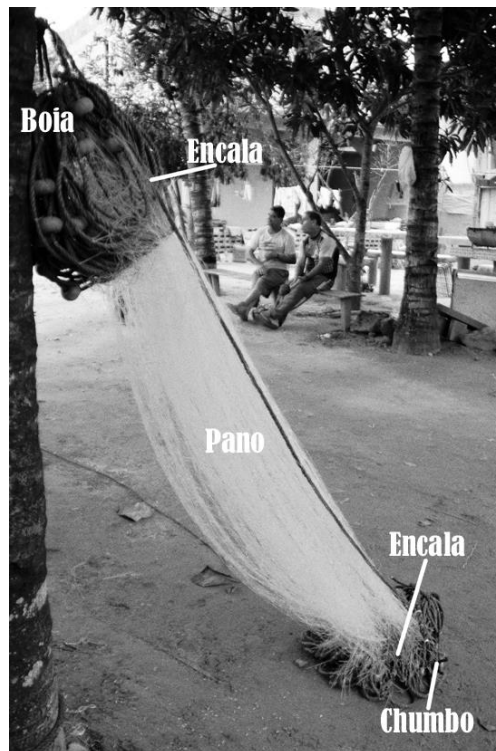
Imagem 2 – Rede de pesca.

A rede é composta basicamente por quatro partes: a boia; o chumbo, a encala e o pano (ver imagem 2). O que é chamado de boia não é exatamente a boia como a conhecemos, mas a corda onde esta fica presa. A boia é composta por uma corda de multifilamento, do comprimento da rede, e isopores presos espaçados entre si, os quais servem de boias (algumas boias são produzidas em poliuretano) Essa parte é responsável por manter a rede sob a água na vertical. Trata-se da parte superior da rede.